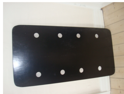
1 x sengebund