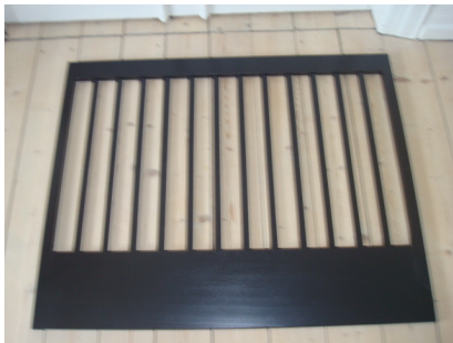
2 x sider