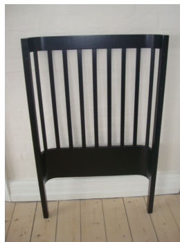
2 x gavle