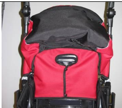
Justering af rygstøtte