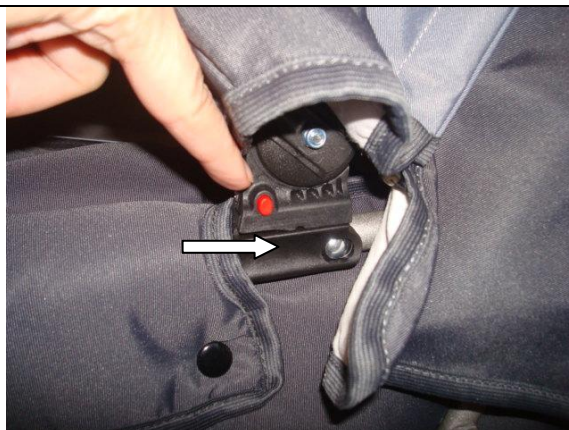
Af og påmontering af kaleche

ADVARSEL – Benyt altid skridtstrop sammen med taljebæltet.