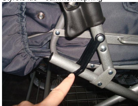
Sikringslås - sammenklapning