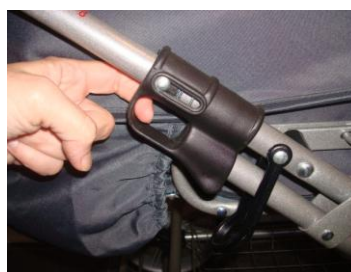
Styrets lås – sammenklapning